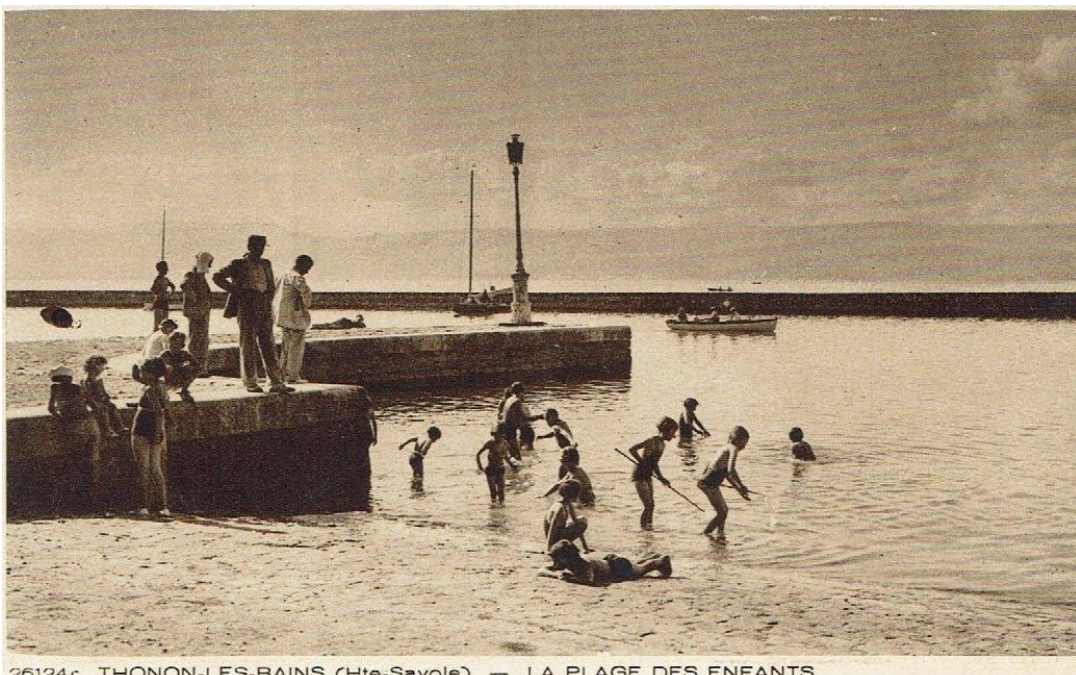
26124c THONON-LES-BAINS (Hte-Savoie) — LA PLAGE DES ENFANTS